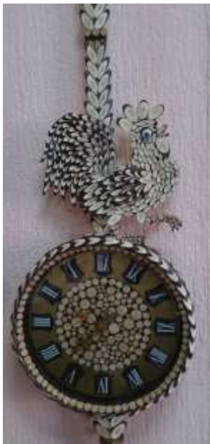
Часы «Символ года»