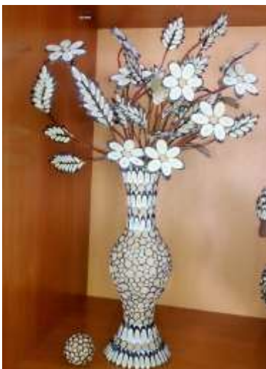
Объемная композиция «Цветы»