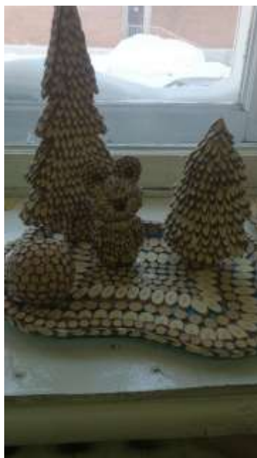
Объемная композиция «Горная Шория»