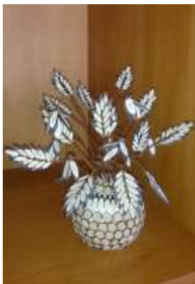
Объемная композиция «Подснежники»